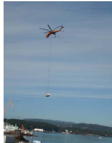
On utilise un hélicoptère Aircrane Sikorsky-64 pour soulever les huit unités de traitement de l'air du site Yarrows jusqu'au dessus des parties actuelles et nouvelles du bâtiment DY250.