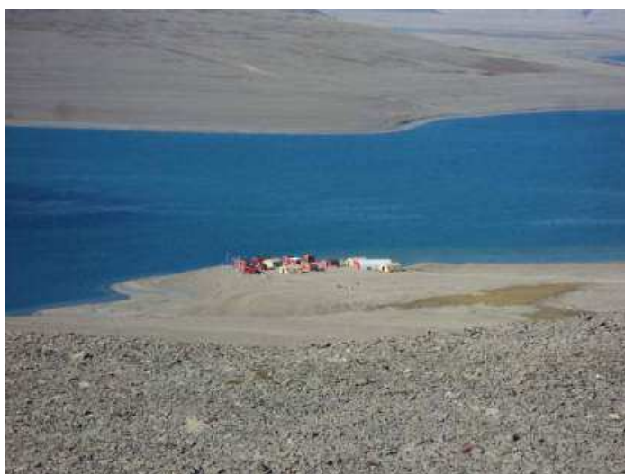
Vue de Gascoyne Inlet, désolé et éloigné, à partir d'une colline des environs.

personnel de construction est arrivé à Resolute Bay, le dernier bastion de civilisation de cette région, à bord de vols nolisés et militaires.