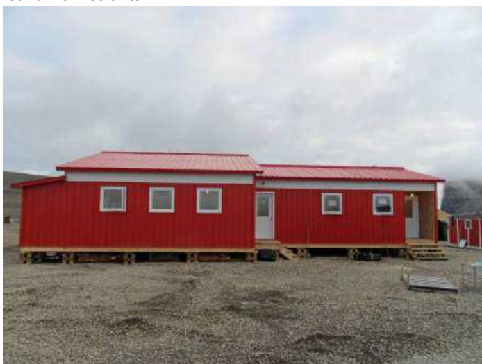
Le bâtiment abritant le dortoir, la cuisine et la salle à manger, aussi appelé « The Big Red Barn », une fois terminé.