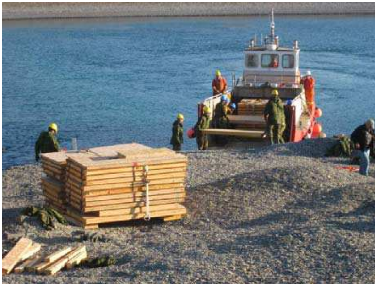
La troupe de construction navale décharge le chaland de la Garde côtière à Gascoyne Inlet un panneau à la fois.

Le projet semblait assez simple; il s'agissait de construire un bâtiment doté de trois chambres, d'une cuisine et d'une salle à manger. Toutefois, l'emplacement, soit à Gascoyne Inlet sur l'Île Devon, qui se trouve à environ 120 km à l'est de Resolute Bay au Nunavut, a rendu beaucoup plus difficile un projet qui aurait autrement été simple. Recherche et développement pour la défense du Canada (RDDC) s'est joint à la 4e Équipe spécialisée du génie (ESG) de la 1re Unité d'appui du Génie (UAG) de Moncton en vue de construire des habitations dans cette région éloignée du cercle arctique dans le cadre d'un projet de plus grande envergure visant à surveiller des routes maritimes dans les eaux du Nord canadien. Le projet comprenait également des travaux de terrassement et d'arpentage des zones entourant le camp.