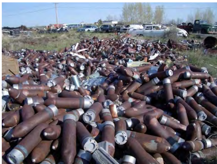
Des obus d'exercice à tête écrasante de 120mm traînant dans une cours à ferraille en Alberta, avant que ne soit entrepris le nettoyage du site.

Il y a quelques jours, l'équipe du Directeur de la Gestion des Biens immobiliers (2) du SMA (IE) s'est vu décerner une note d'excellence par le Directeur - Réglementation des explosifs et munitions (DREM) quant à leur façon de procéder l'année dernière au nettoyage de rebus de munitions qui se trouvaient dans certaines cours à ferraille de l'Alberta.