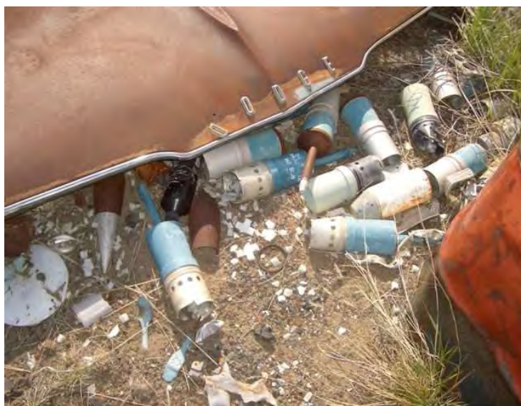
Des projectiles d'exercice Carl Gustav de 84mm, des fusées éclairantes de 81mm ainsi que des obus de 120mm d'exercice à sabot largable avant le début des opérations de nettoyage.