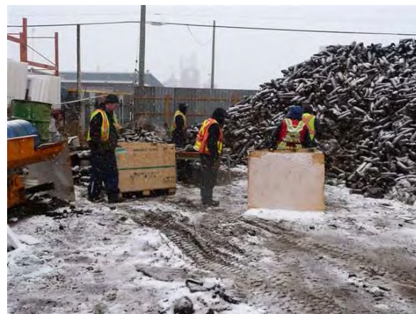
Des milliers d'obus d'exercice à tête écrasante de 120mm empilés dans une cours à ferraille en Alberta, tels qu'ils pouvaient être vus au début des opérations de nettoyage de ce site.