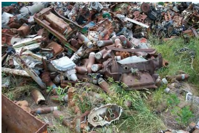
Des obus d'exercice à tête écrasante de 120mm jonchent sur le sol, entremêlés de différentes pièces de métal.