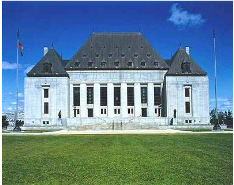
La Cour suprême du Canada

Le Canada a l'obligation légale de consulter les groupes autochtones lorsqu'il envisage de prendre des mesures susceptibles d'avoir un effet préjudiciable sur les droits ancestraux potentiels ou établis qui sont protégés par la Loi constitutionnelle de 1982 . Jusqu'à maintenant, on ne connaissait pas bien l'incidence de l'existence d'une ERTG sur l'obligation légale de consulter.