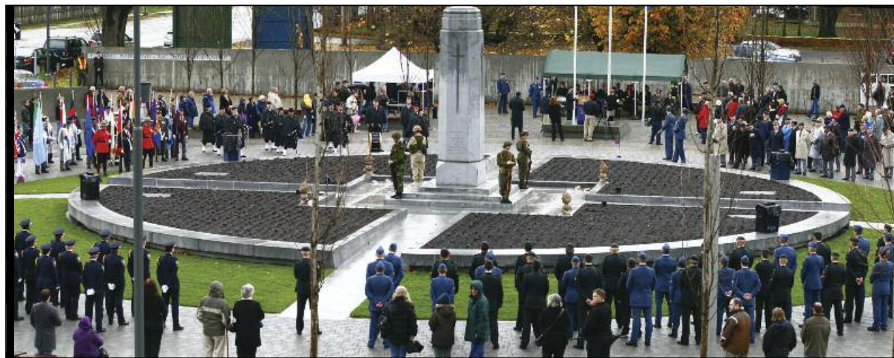
On a inauguré le Monument commémoratif des sapeurs restauré en 2009.