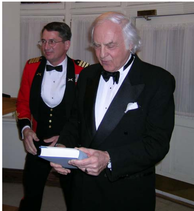
From left to right, the Branch Advisor and the Guest of Honour, the Honourable Mr. Justice Morris J. Fish, Supreme Court of Canada

De gauche à droite, le conseiller de la Branche et l'invité d'honneur, l'Honorable M. le juge Morris J. Fish, Cour suprême du Canada